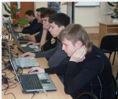
Фото 2. Медиатека

На территории школы расположены: лыжная база, спортивная площадка, учебно-опытный пришкольный участок.