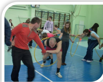
Фото 1. Спортивные соревнования совместно с молодыми специалистами ОАО НК НПЗ

В школе работают целевые и творческие программы: «Здоровье», «Игра – дело серьезное», «Свой голос»; многофункциональная творческая игра «Лестница успеха». Целевая программа «Здоровье» направлена на создание здоровьесберегающей образовательной среды и обеспечение безопасности школьников. Реализация программы идет по трем направлениям: медицинское, педагогическое и социально-психологическое. Здесь не только выполнение СанПиН, норм охраны труда,