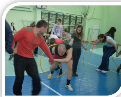
Фото 1. Спортивные соревнования совместно с молодыми специалистами ОАО НК НПЗ

Целевая программа «Здоровье» направлена на создание здоровьесберегающей образовательной среды и обеспечение безопасности школьников. Реализация программы идет по трем направлениям: медицинское, педагогическое и социально-психологическое. Здесь не только выполнение СанПиН, норм охраны труда, противопожарной безопасности и гражданской обороны, но и повышение уровня материально-технического обеспечения безопасных условий в образовательной среде (например: автоматическая пожарная сигнализация, установление «тревожной» кнопки...), и проведение практических мероприятий с учащимися и педагогами (в т.ч. динамические перемены, увеличение количества спортивно-массовых мероприятий и проведение их с учетом групп здоровья учащихся и т.д.).