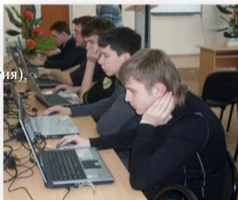
Фото 2. Медиатека

На территории школы расположены: лыжная база, спортивная площадка, учебно-опытный пришкольный участок.