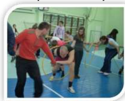
Фото 1. Спортивные соревнования совместно с молодыми специалистами ОАО НК НПЗ

В школе работают целевые и творческие программы: «Здоровье», «Игра – дело серьезное», «Свой голос»; многофункциональная творческая игра «Лестница успеха». Целевая программа «Здоровье» направлена на создание здоровьесберегающей образовательной среды и обеспечение безопасности школьников. Реализация программы идет по трем направлениям: медицинское, педагогическое и социально-психологическое. Здесь не только выполнение СанПиН, норм охраны труда, противопожарной безопасности и гражданской обороны, но и повышение уровня материально-технического обеспечения безопасных условий в образовательной среде (например: автоматическая пожарная сигнализация, установление «тревожной» кнопки...), и проведение практических мероприятий с учащимися и педагогами (в т.ч. динамические перемены, увеличение количества спортивно-массовых мероприятий и проведение их с учетом групп здоровья учащихся и т.д.).